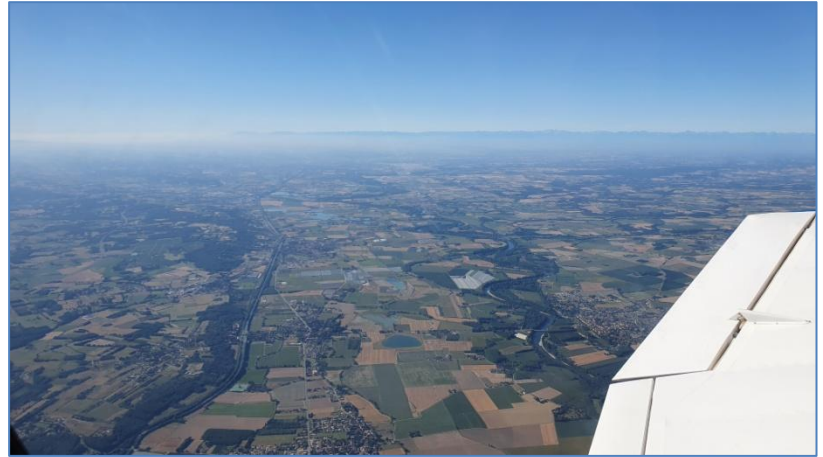
Montée en niveau de vol du BO.

Le dimanche matin, 3 pilotes dans le VK et 3 dans le BO, à 5 minutes d'intervalle, ont quitté Gaillac à destination d'Andernos.