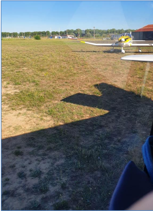
Départ des avions à 9h15.

Le dimanche matin, 3 pilotes dans le VK et 3 dans le BO, à 5 minutes d'intervalle, ont quitté Gaillac à destination d'Andernos.